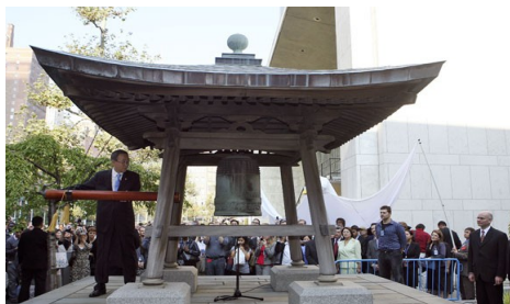
La cloche de la paix

Depuis 2002, la journée internationale de la paix est célébrée au siège des Nations Unies par une cérémonie en présence du secrétaire-général qui fait sonner la Cloche de paix . Celle-ci a été offerte par l'Association du Japon des Nations Unies en juin 1954. Elle été fabriquée à partir de pièce de monnaie et de médailles données par les représentants des Etats membres, le Pape, et des enfants de tous les continents.