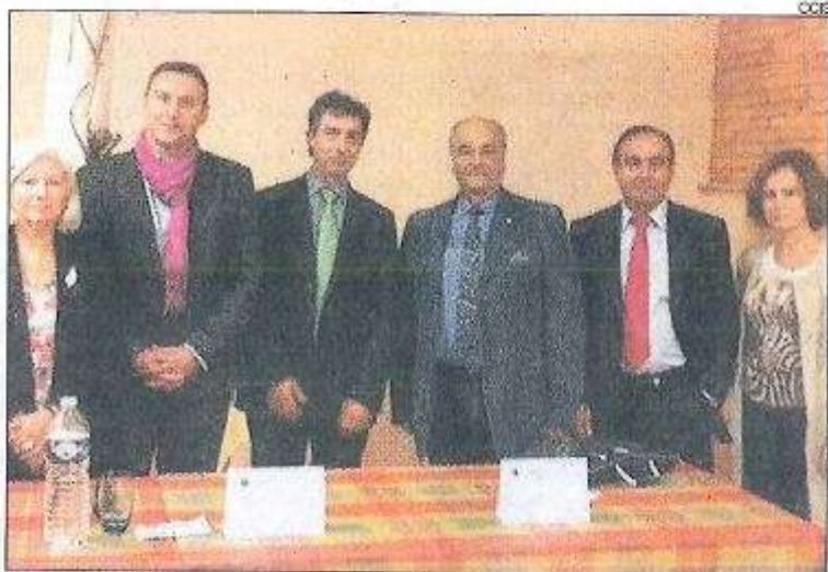
Un moment de l'acte organitzat ahir a Tolosa.

El president de la Cambra va presentar la nova Llei d'inversió estrangera, així com el nou marc fiscal i la signatura del conveni de no doble imposició amb França, que posa l'economia andorrana, segons la nota feta pública, "en situació de competir en igualtat de condicions amb les economies veïnes, alhora que fa que Andorra constitueixi una destinació atractiva per a nous sectors i empreses".