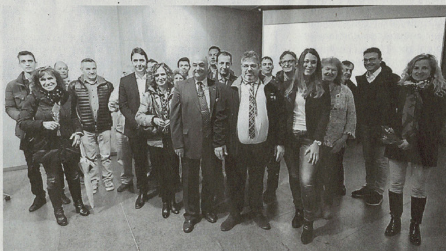
Freemintronic et ses partenaires lors de la tribune « Andorre, pays pilote de l'innovation 2017 »

Freemintronic SL, entreprise franco-andorrane, avec laquelle l'ADEC-NS a collaboré en mars dernier lors d'une mission multisectorielle en Andorre, a été désignée par le jury du 9 ème Forum international de la Cybersécurité à Lille comme faisant partie des 10 entreprises les plus innovantes dans le domaine de la cybersécurité. Elle a reçu le 22 mars le 1 er Trophée qui réunit deux disciplines nationa-